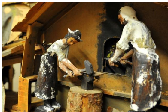
pohyblivé figury kovářů v kovárně (před opravou)