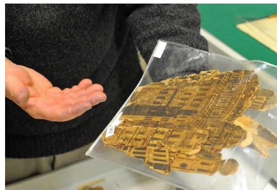
nejstarší část betléma – fragment města