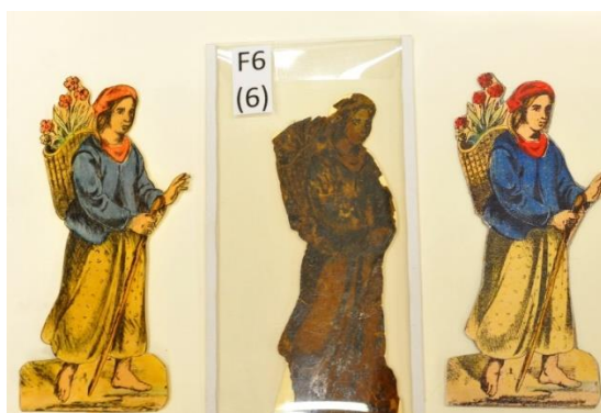
papírová figura před a po restaurování